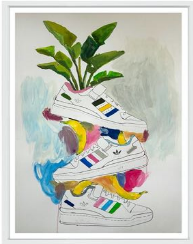
Título: "Banana Forum" Año: 2023 Técnica: Mixta sobre papel de algodón 300 gr. Dimensiones: 70 cm x 50 cm