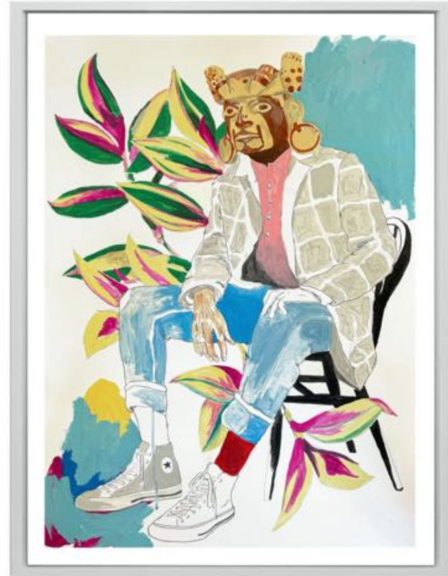
Título: "Guerrero 2" Año: 2023 Técnica: Mixta sobre papel de algodón 300 gr. Dimensiones: 70 cm x 50 cm