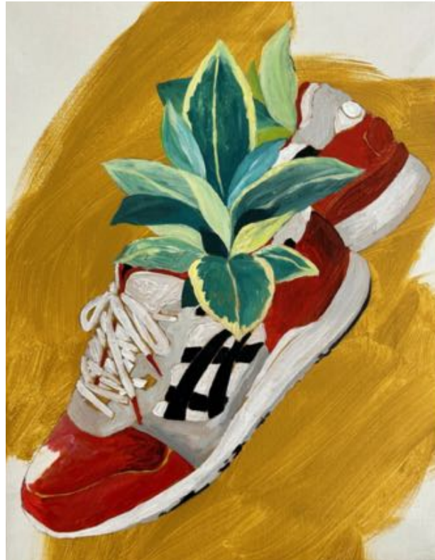
Título: "Estos no son los zapatos de van gogh" Gel Año: 2023 Técnica: Acrílico sobre lienzo Dimensiones: 40 cm x 30 cm