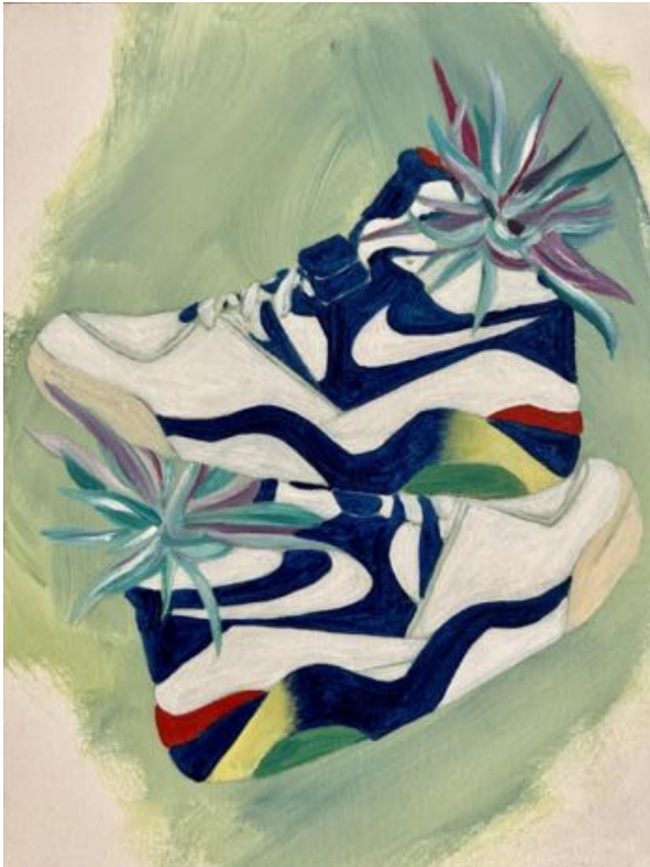
Título: "Estos no son los zapatos de van gogh" Force Año: 2023 Técnica: Acrílico sobre lienzo Dimensiones: 40 cm x 30 cm